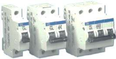
Tipos de llaves Térmicas.

Es un elemento de protección contra cortacircuitos y sobrecargas. Se instalarán con la sensibilidad adecuada para la protección de los conductores y equipos instalados en la derivación (como lo indica la Unifilar general adjunta)