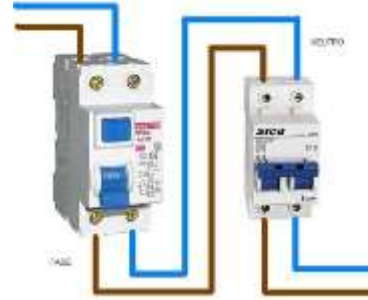
Conexión de Diferencial con Térmica.